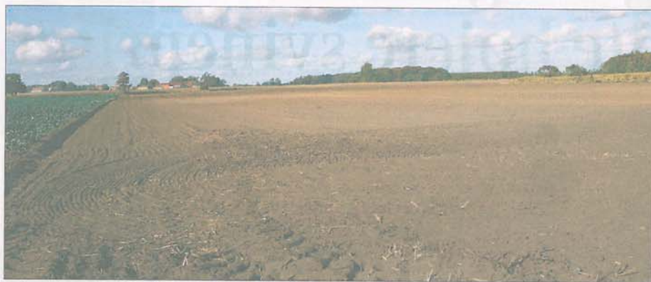
De største planteavlbrug kom dårligst ud af 2010 målt pr. hektar, mens de små planteavlbrug klarede sig bedst.

Sammenlignes de største planteavlbrugs resultater med de næststørste, bliver for-